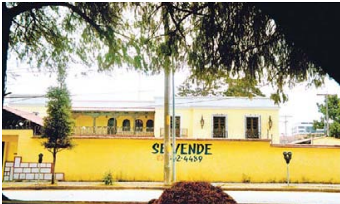
EN VENTA. Esta es una de las casas de Ortega, aquí también estuvo la empresa Sertecsa. El militar confiesa que luego de las acusaciones en su contra se le dificulta vender la propiedad.

Siglo Veintiuno estableció que ese movimiento aún no existe en el Registro Mercantil. Una copia obtenida hace una semana da cuenta de ello.