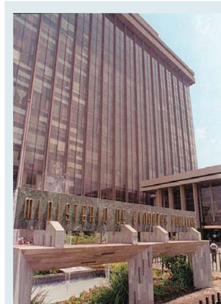
LA SEDE. El imponente edificio del Ministerio de Finanzas albergó, según el informe de la Comisión para el Esclarecimiento Histórico, una oficina clandestina en la que se incubó una mafia.