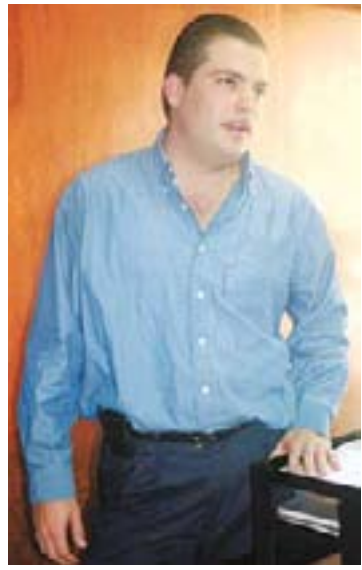
MOVIMIENTO. Llorc, escondido en El Salvador, crea una empresa.