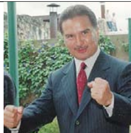
INFLUENCIA. Alfonso Portillo nombró a decenas de funcionarios acusados de corrupción.

Sus relaciones son añejas y se evidenciaron cuando el Ministerio Público allanó la casa de Alfredo Moreno, supuesto capo del contrabando aduanero. En ese lugar los fiscales encontraron archivos de los militares y varias fotografías en donde aparecía Moreno y Portillo en Washington. Y otras tomas en donde aparece Ortega y Moreno.