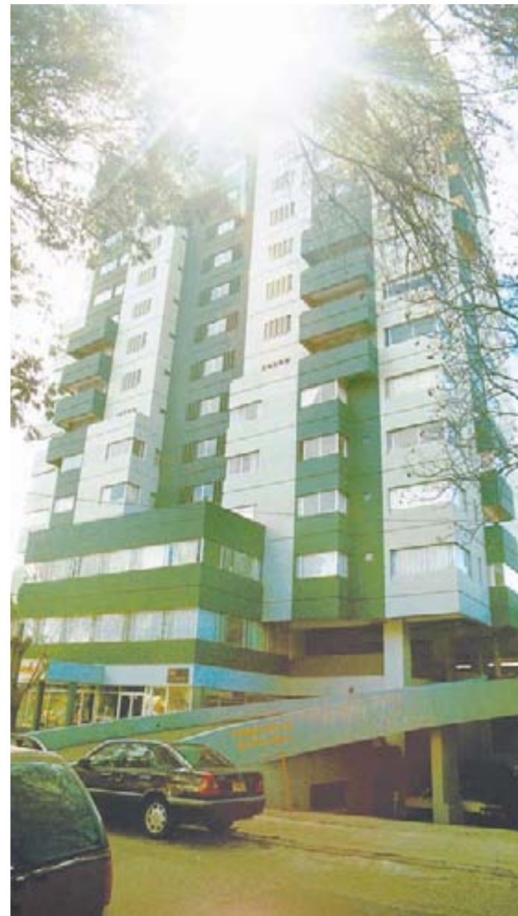
En el edificio Vista al Lago, zona 13, tuvo sus oficinas Confía y muchas de las empresas vinculadas a José Armando Llorit.

El origen de esos Q200 millones depositados en una cuenta de Confía se desconoce. Pero Siglo Veintiuno tiene documentado que esa financiera lo recibió en